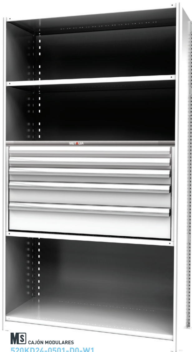
MS CAJÓN MODULARES 520KD24-0501-D0-W1 ◀ 48" ▽ 24½" ◆ 24" 🗑️ 5 🗋️ 108